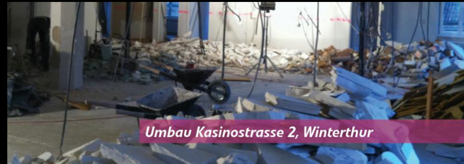
Umbau Kasinostrasse 2, Winterthur