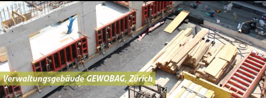
Verwaltungsgebäude GEWOBAZ, Zürich