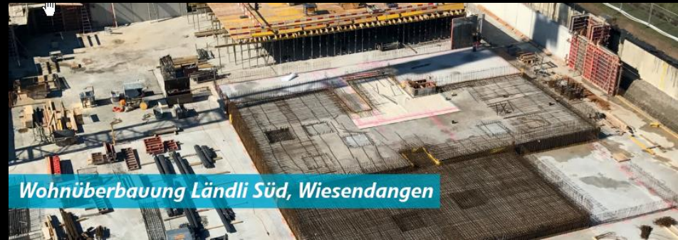
Wohnüberbauung Ländli Süd, Wiesendangen