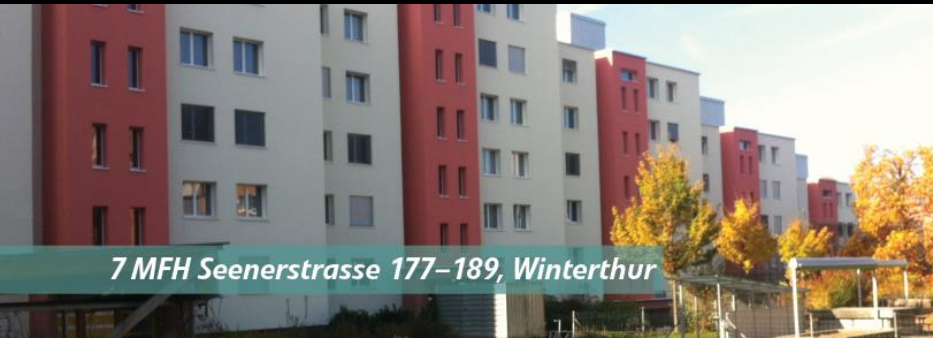
7 MFH Seenerstrasse 177-189, Winterthur