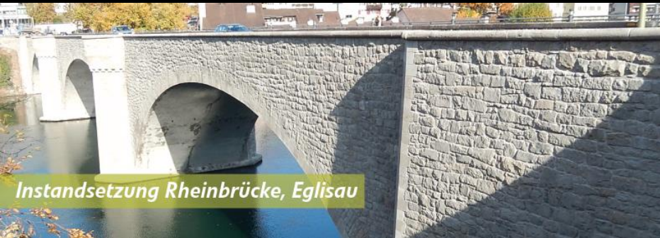
Instandsetzung Rheinbrücke, Eglisau