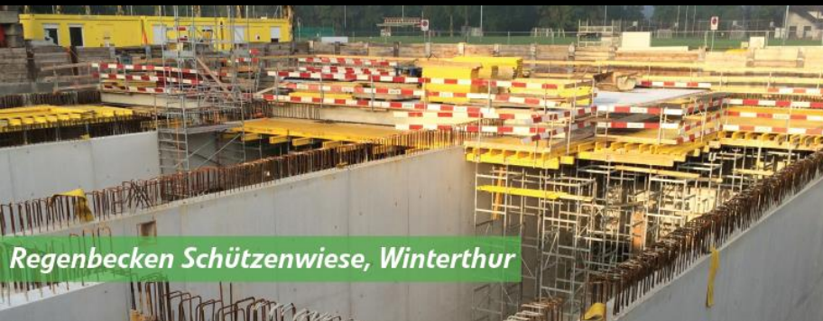
Regenbecken Schützenwiese, Winterthur