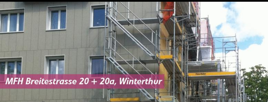
MFH Breitestrasse 20 + 20a, Winterthur