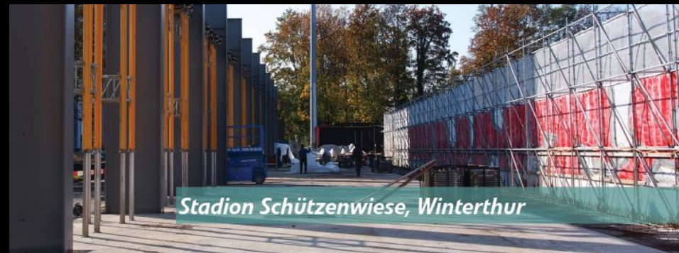
Stadion Schützenwiese, Winterthur