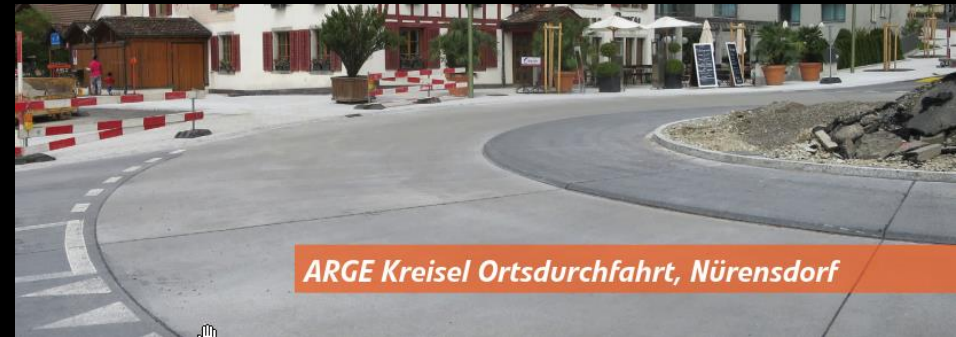
ARGE Kreisel Ortsdurchfahrt, Nürensdorf