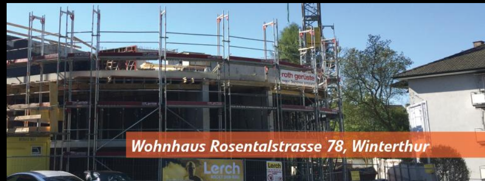
Wohnhaus Rosentalstrasse 78, Winterthur