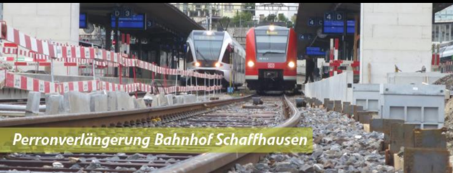
Perronverlängerung Bahnhof Schaffhausen